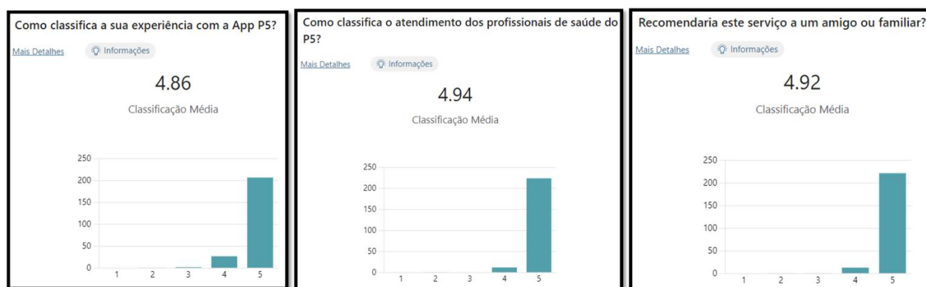
Figura 1. Avaliação da satisfação e qualidade do serviço Triagem e Aconselhamento em Saúde P5 (avaliação por 237 utentes).